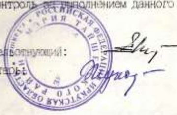
Ф. Р-178. оп.1. едхр. 30. стр 3. постановление от 06 марта 2000 года