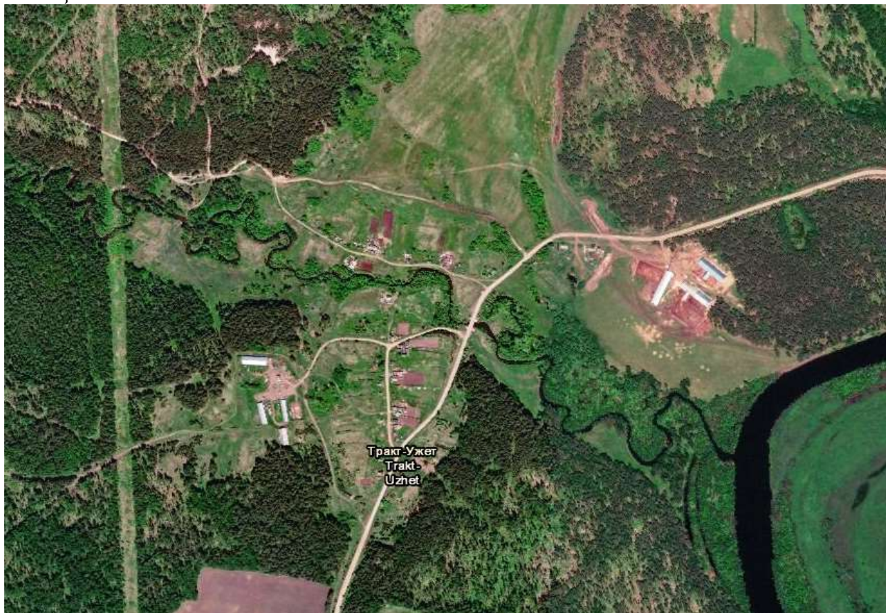
Рисунок 1д.Тракт - Ужет спутниковая карта