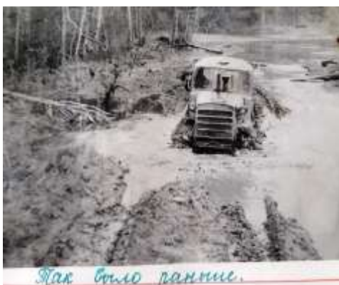
Так было раньше.

Школа в Волнистом закрылась с 1 июня 1975 г. по решению райисполкома от 13 мая 1975 г. Правлению колхоза вменялся ежедневный подвоз детей в Черчетскую школу. Позже в селе был открыт интернат для детей из Волнистого .