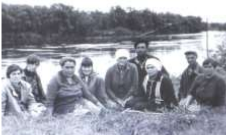
Черчетцы на колхозном покосе острова р.Бирюса

- план за декабрь 1976 г. надоили 189 кг на корову (132 кг было в 1975 г) Если судить по имеющимся семи показателям суточного надоя, то средний надой на корову в этом году был 7.4 кг, в 1975 г лишь 5.5 кг молока. Иные месяца черчетские доярки в сводках значились на 4-5 строках по району. Успех животноводов колхоза на