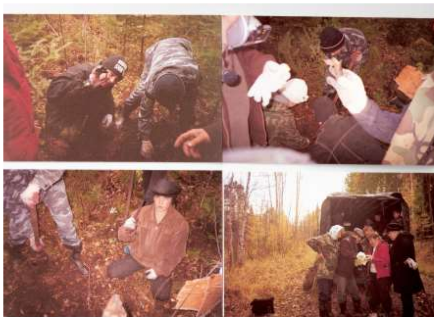
ВПО «Исайкина заимка на месте падения самолёта.

Объём выполненной работы и оценка результатов говорит о больших воспитательных возможностях общественной организации. ВПО с успехом воспитывает юных патриотов, пытливых исследователей, бесстрашных защитников Родины.