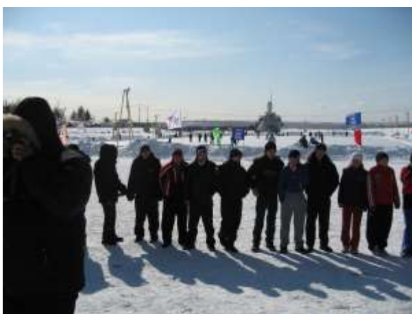
На льду Ангары

В феврале заняли 1-е место в районных соревнованиях дворовых хоккейных команд (грамота, ценный подарок) и в марте поехали на областные соревнования, где заняли 4-е место (ценный подарок).