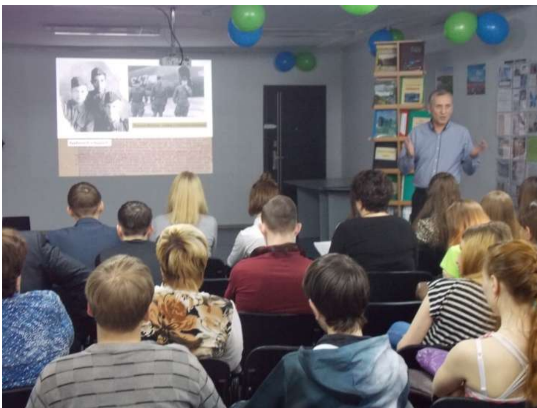
Рассказ о статье Именослова - «Алсиб»