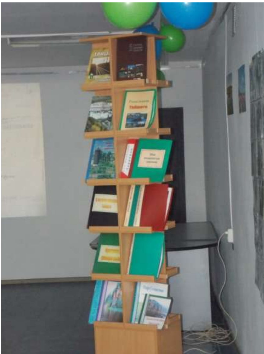
Книжная выставка к презентации Именослова. Папки-накопители краеведческих материалов