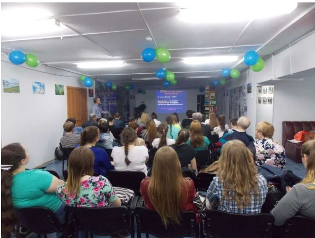
Во время презентации именослова 27 апреля 2017 г. Актовый зал Центральной библиотеки